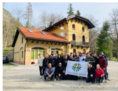
GRUPPO "ISSIMI" - 9 di VALLONGA + 2 EDUCATORI * 6 - 7 aprile Weekend di Spiritualità Diocesano a Posina (VI)

L'AZIONE CATTOLICA ITALIANA INCONTRA PAPA FRANCESCO "A BRACCIA APERTE" * ROMA * 25 aprile